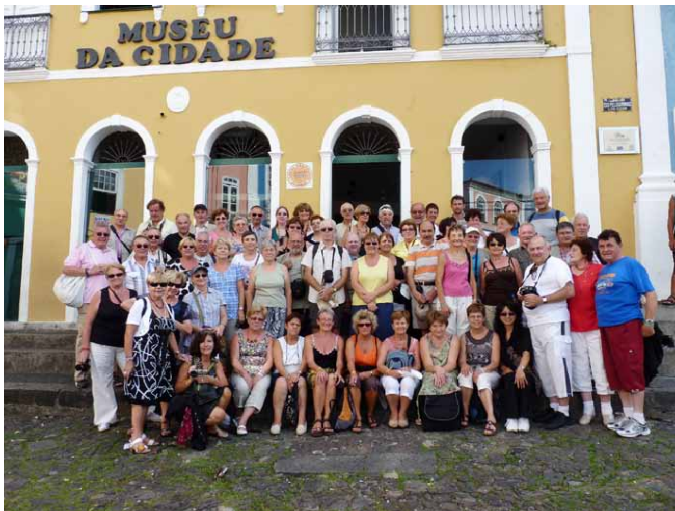
Les participants au voyage du Brésil